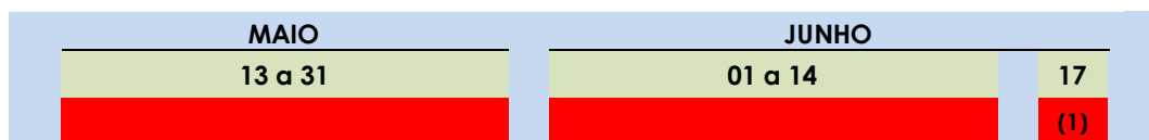
(1) Avaliação presencial da Componente Geral

Haverá uma avaliação final global PRESENCIAL da Componente Específica agendada para o dia 17 de JUNHO de 2026 (quarta-feira) em Viana do Castelo (local a designar), às 21h00.